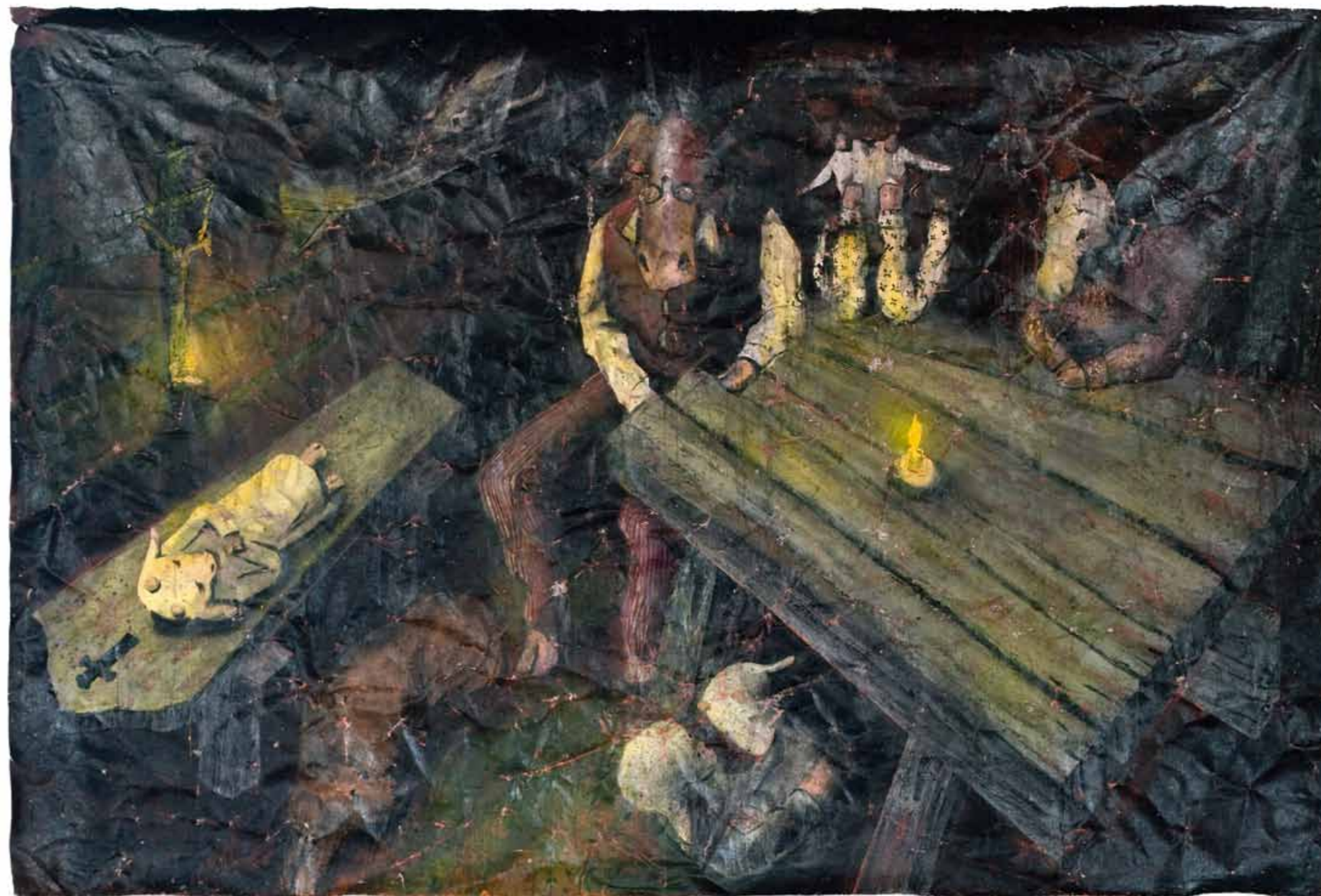
Luděk Rathouský, Devatenácté století, 2008, akryl na plátně, 200 x 300 cm / Neunzehnten Jahrhunderts, 2008, Acryl auf Leinwand, 200 x 300 cm