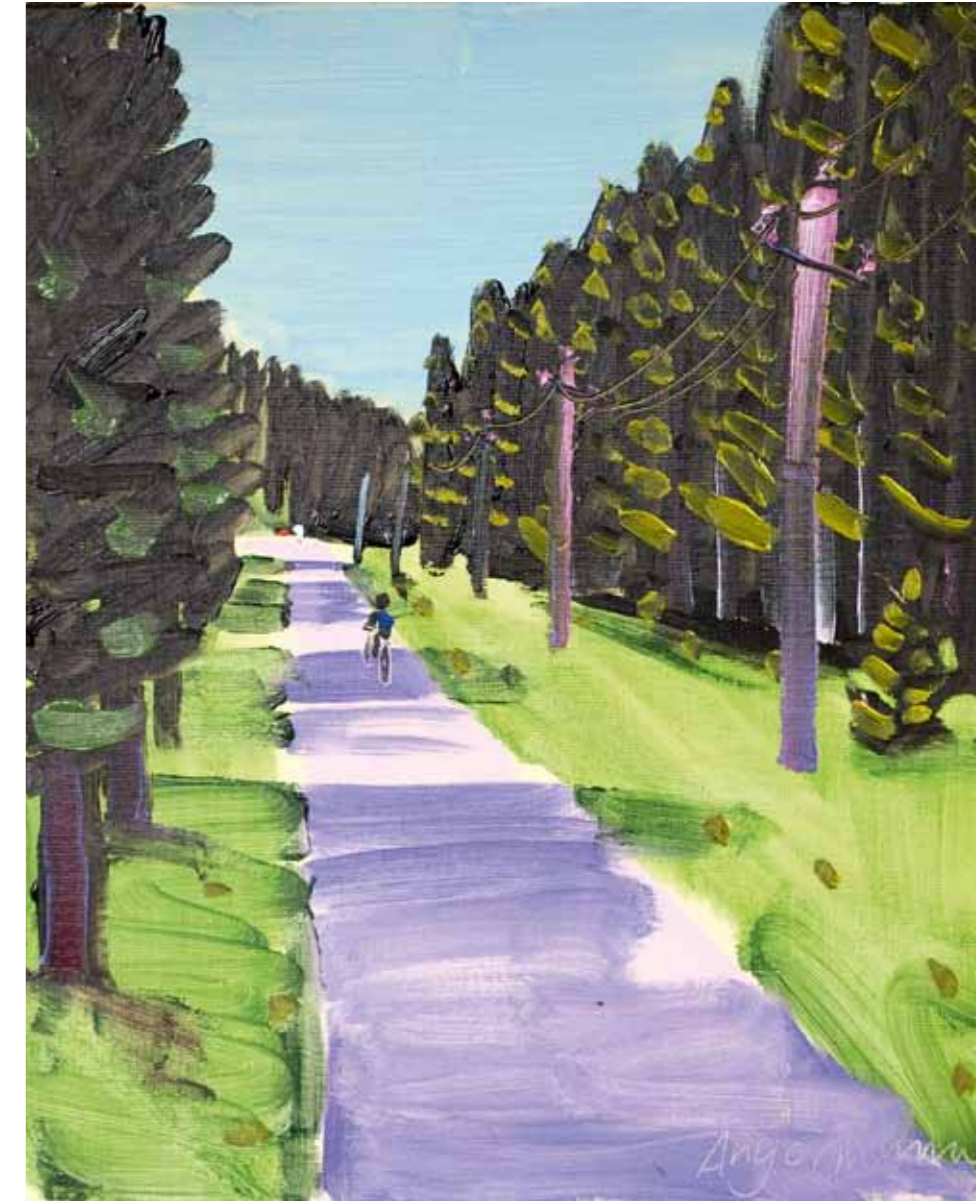
Peter Angermann, 2008, Kvilda, olej na plátně, 50 x 40 cm Peter Angermann, 2008, Außergefeld, Öl auf Leinwand, 50 x 40 cm