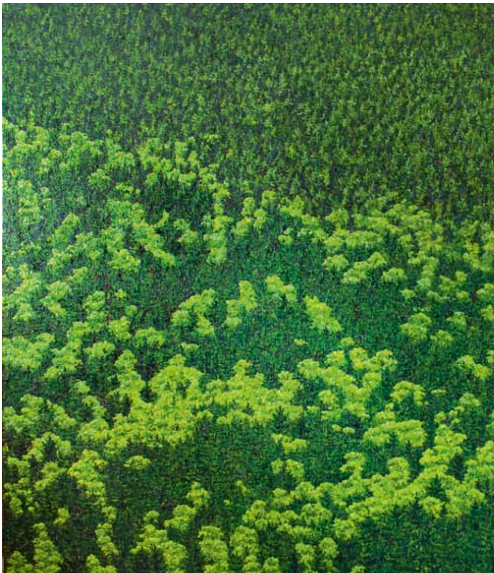
Katharina Dietlinger, Šumava, 2009, olej na plátně, 200 x 200 cm (detail) Katharina Dietlinger, Böhmerwald, 2009, Öl auf Leinwand, 200 x 200 cm (Detail)