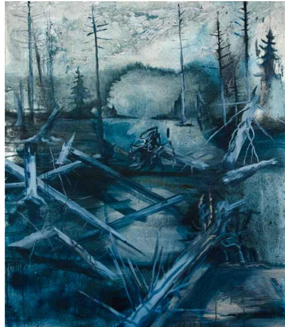
Martin Salajka, Polomy, 2012, akryl na plátně, 115 x 105 cm Martin Salajka, Baumbruch, 2012, Acryl auf Leinwand, 115 x 105 cm