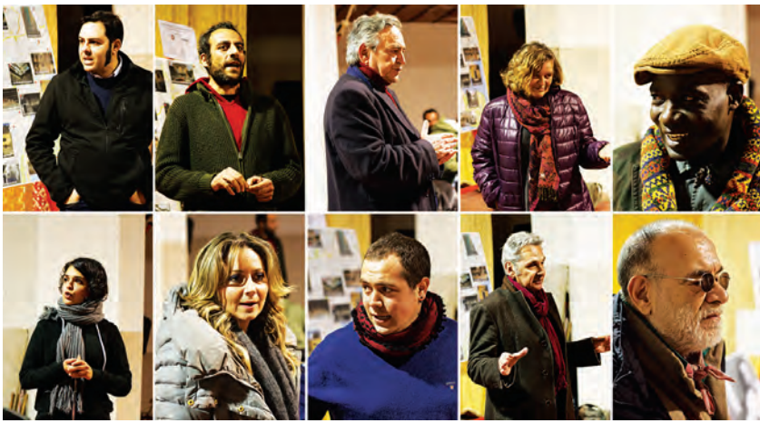
A sinistra: alcuni interventi all'assemblea del 5 gennaio.