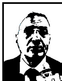
GIORGIO LA MALFA deputato Pri. ministro politiche comunitarie

2 anni definitivi per frode fiscale e false fatture a Torino (false fatture Publitalia); ha patteggiato a 6 mesi a Milano per altre vicende di false fatture Publitalia.