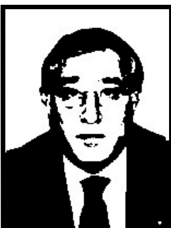
MARCELLO DELL'UTRI senatore Forza Italia e membro del Consiglio d'Europa

8 mesi definitivi per favoreggiamento nel processo tangenti Guardia di Finanza.