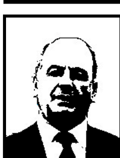
AUGUSTO ROLLANDIN senatore Union Valdotain-Ds

Ex sindaco socialista di Asti, nel '96 ha patteggiato 6 mesi e 26 giorni di carcere per inquinamento delle falde acquifere, abuso e omissione di atti ufficio, falso ideologico, delitti colposi contro la salute politica (per l'inquinamento delle falde acquifere) e omessa denuncia dei responsabili della Tangentopoli astigiana nello scandalo della discarica di Vallemanina e Valleandona (smaltimento fuorilegge di rifiuti tossici e nocivi in cambio di tangenti).