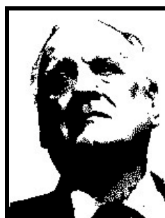
ALFREDO BIONDI deputato Forza Italia

Condannato definitivamente dalla Cassazione nel 2001 per abusivismo edilizio, per via di alcuni ampliamenti illeciti nella sua casa a Pantelleria; 10 giorni di arresto e 20 milioni di lire di ammenda, più "l'ordine di pristino dei luoghi". Cioè la demolizione delle opere abusive.