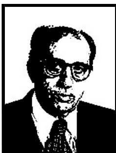
LINO JANNUZZI senatore Forza Italia

1 anno e 8 mesi definitivi per finanziamento illecito tangente Enimont, 2 mesi patteggiati per corruzione per fondi neri ENI.