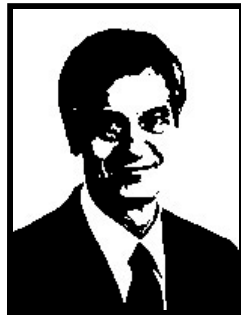
GIORGIO CALVAGNO deputato Forza Italia

Ex sindaco socialista di Asti, nel '96 ha patteggiato 6 mesi e 26 giorni di carcere per inquinamento delle falde acquifere, abuso e omissione di atti ufficio, falso ideologico, delitti colposi contro la salute politica (per l'inquinamento delle falde acquifere) e omessa denuncia dei responsabili della Tangentopoli astigiana nello scandalo della discarica di Vallemanina e Valleandona (smaltimento fuorilegge di rifiuti tossici e nocivi in cambio di tangenti).