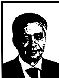
CALOGERO SODANO senatore Udc

Condannato definitivamente a 4 mesi e 20 giorni per resistenza a pubblico ufficiale durante la perquisizione della polizia nella sede di via Bellerio a Milano.