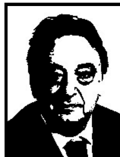
GIANNI DE MICHELIS eurodeputato Socialisti Uniti per l'Europa

Già sindaco di Agrigento, condannato definitivamente a 1 anno e 6 mesi per abuso d'ufficio finalizzato a favorire i costruttori abusivi in cambio di favori elettorali.