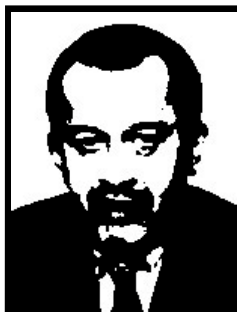
ROBERTO MARONI deputato Lega Nord e ministro Lavoro

1 anno e 4 mesi patteggiati per truffa ai danni del Ministero del Lavoro e della CEE per 474 milioni di lire in cambio di falsi corsi di qualificazione professionale per la sua azienda.