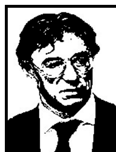
UMBERTO BOSSI eurodeputato e segretario Lega Nord

Condanna definitiva a 6 mesi e 20 giorni per finanziamento illecito Enimont.