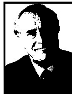
GIAMPIERO CANTONI senatore Forza Italia

1 anno e 6 mesi patteggiati a Milano per corruzione per le tangenti autostradali del Veneto; 6 mesi patteggiati per finanziamento illecito Enimont.