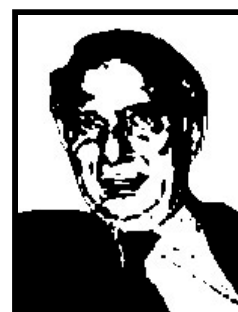
PAOLO CIRINO POMICINO eurodeputato Udeur

Condannato a Milano a oltre 6 anni di reclusione definitivi per le tangenti delle discariche (3 anni e 9 mesi, corruzione) e per altri due scandali di Tangentopoli (2 anni e 11 mesi per concussione, corruzione, ricettazione e finanziamento illecito).