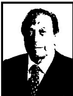
WALTER DE RIGO senatore Forza Italia

1 anno e 4 mesi patteggiati per truffa ai danni del Ministero del Lavoro e della CEE per 474 milioni di lire in cambio di falsi corsi di qualificazione professionale per la sua azienda.