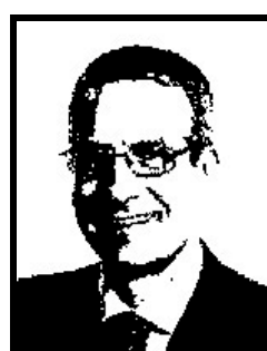
ANTONIO TOMASSINI senatore Forza Italia

2 mesi e 20 giorni patteggiati per finanziamento illecito Enimont; 1 anno 8 mesi e 20 giorni patteggiati per i finanziamenti illeciti della metropolitana milanese.