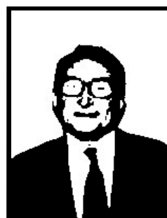
GIANSTEFANO FRIGERIO deputato Forza Italia

2 mesi patteggiati per evasione fiscale a Genova. La sentenza di condanna a suo tempo resa dal tribunale di Genova nei confronti di Alfredo Biondi è stata revocata in data 28 settembre 2001 per intervenuta abrogazione del reato.