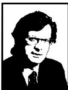
VITTORIO SCARBI deputato Forza Italia

Come ex presidente della Bnl in quota Psi, inquisito e arrestato per corruzione, bancarotta fraudolenta, ha patteggiato la pena e risarcito 800 milioni.