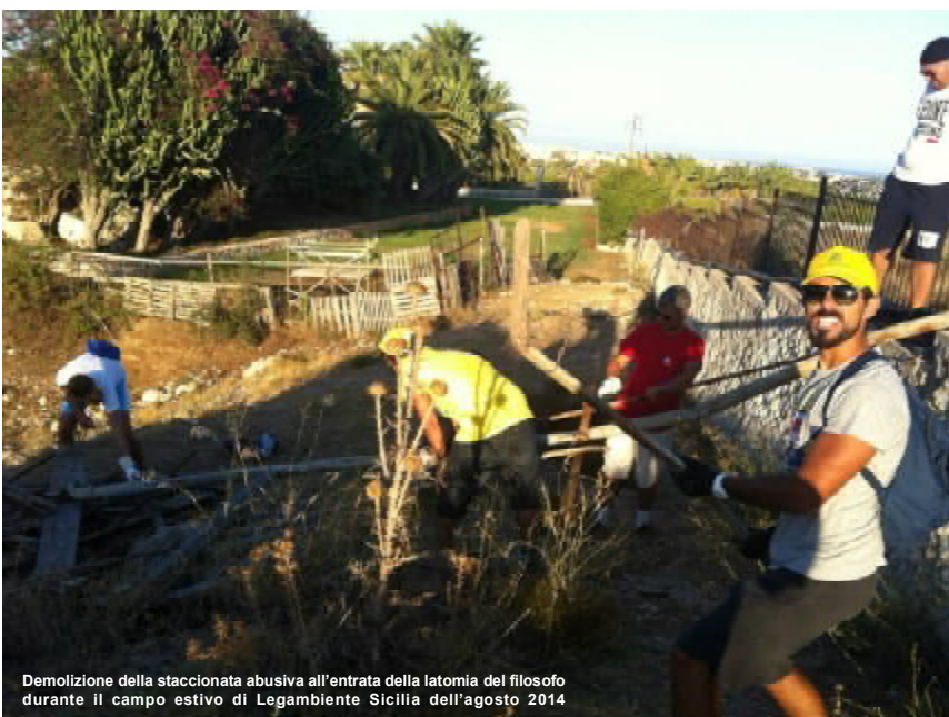
Demolizione della staccionata abusiva all'entrata della latomia del filosofo durante il campo estivo di Legambiente Sicilia dell'agosto 2014