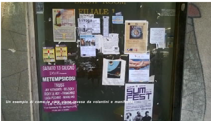
Un esempio di come la città viene invasa da volantini e manifesti

L'abitudine di attaccare ovunque volantini o locandine che pubblicizzano iniziative di ogni tipo sta diventando un vero e proprio sopruso alla bellezza