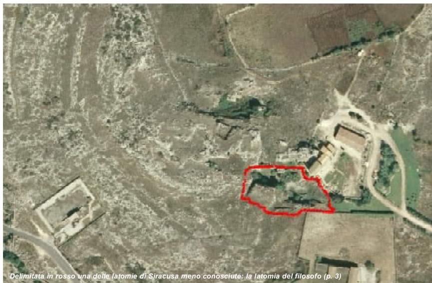
Delimitata in rosso una delle latomie di Siracusa meno conosciute: la latomia del filosofo (p. 3)